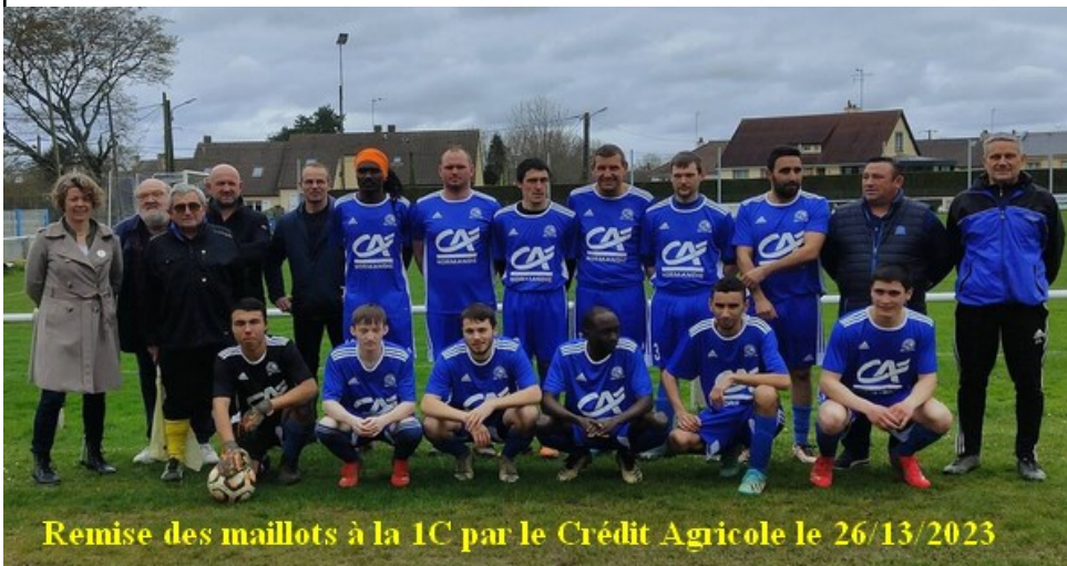
Remise des maillots à la 1C par le Crédit Agricole le 26/13/2023

Les résultats du club : https://footorne.fff.fr/recherche-clubs/?scl=4128&tab=resultats