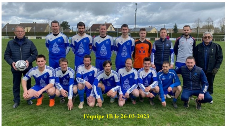
l'équipe 1B le 26-03-2023